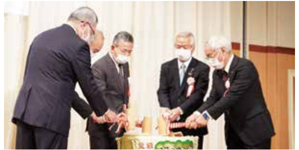
祝賀会は来賓の皆さんによる鏡割りで景気よくスタート。146名が節目を祝った。