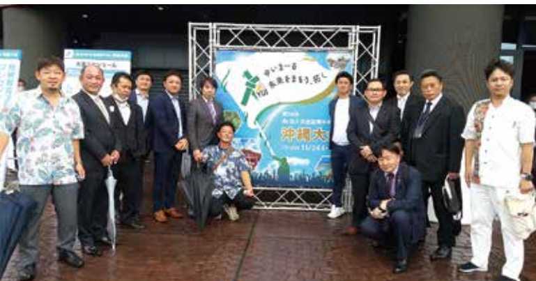
11/24. 25 「全国青年の集い沖縄大会」 青年部会（於：沖縄市・沖縄アリーナ）