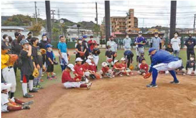
野球経験者に守備の基本を丁寧に教える