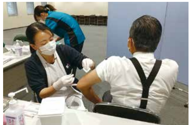
12/5. 7 インフルエンザ予防接種（258名／2日） 厚生委員会（於：横須賀商工会議所）