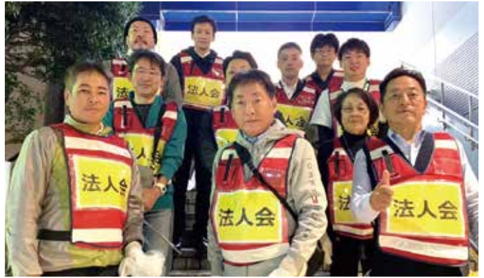
11/10 地域清掃活動 久里浜西支部（於：京急久里浜駅周辺）

地域での清掃活動や税の広報活動、税制改正要望活動、親睦旅行会、青年部会全国大会「全国青年の集い」が沖縄県で開催されるなどのほかに、3年目となったインフルエンザ予防接種も神奈川歯科大学附属病院のご協力を得て258名の会員が受けることができた。