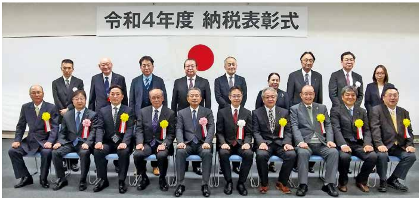
11/7 受彰者の皆さんを囲んで（於：横須賀商工会議所）

11月7日、横須賀税務署「令和4年度納税表彰式」が3年ぶりに挙行された。（於：横須賀商工会議所）