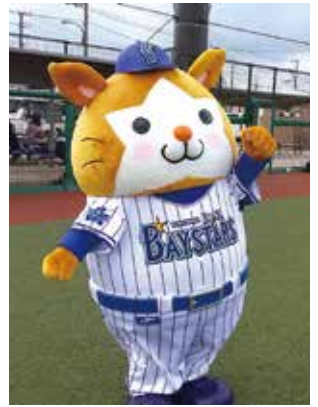
投げる、打つ、初心者の子も野球を楽しく体験。午前は229名、午後は145名の家族が参加した。