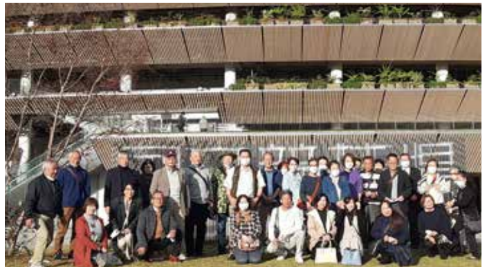
11/24 親睦旅行会 中央第1、2地区会（於：国立競技場）