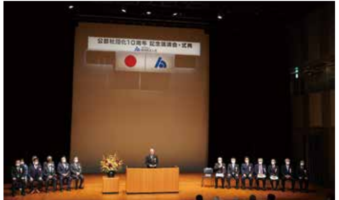
記念式典は多くの来賓が臨席して挙行された