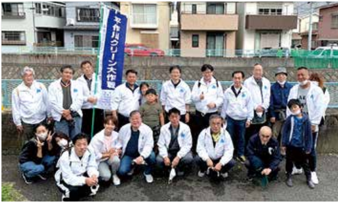
11/13 平作川クリーン大作戦に参加 南西地区会・東部地区会（宮原橋付近）