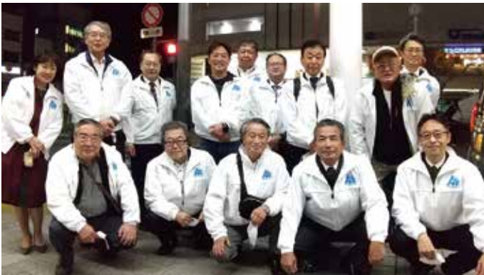
11/15 「税を考える週間」街頭広報 南部地区会（於：京急久里浜駅周辺）