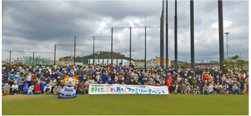
参加者の皆さんで記念撮影（午前の部）

11月22日、記念講演会、式典、祝賀会が開催された。（於：ベイサイドポケットよこすか・メルキュールホテル横須賀）