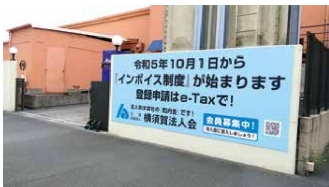
日本水産観光(株)「おいしい広場」敷地(三春町)にインボイスPR看板を設置(広報委員会)