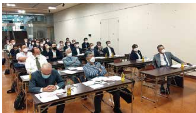
5/23 南西地区会事業報告会とインボイス研修会 於：横須賀市はまゆう会館