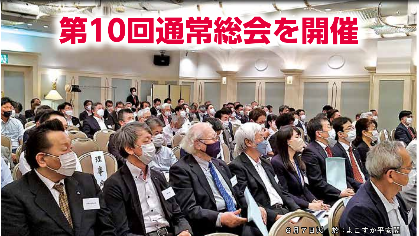
6月7日(火) 於：よこすか平安閣

6月7日(火)、よこすか平安閣に於いて公益社団法人横須賀法人会『第10回通常総会』が開催された。