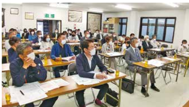
5/24 南部地区会事業報告会とインボイス研修会 於：内川町内会館