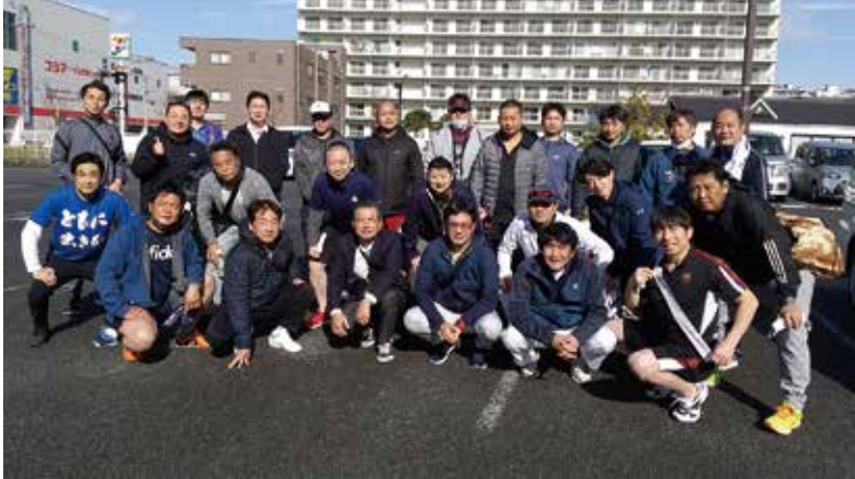
「繋げ、青年部会 絆のたすき」しらかば子どもの家チャリティー駅伝に参加した皆さん（横須賀商工会議所）