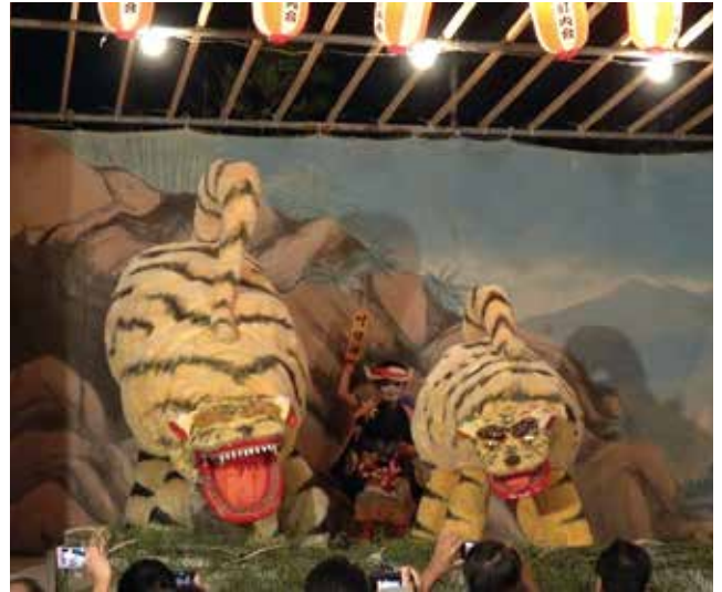
浦賀の虎踊り（西浦賀・為朝神社）

同じ横須賀市内で伝わる「野比の虎踊り」と比べてみると、全体的な構成はよく似ているが、歌や踊りにそれぞれの個性が見られる。また、浦賀では和藤内を5年生くらいの男児が演じるのに対し、野比では成人男性が演じる。また野比では虎を演じる人と芸を変えて数回繰り返される。さらに、登場する虎は一匹のみ