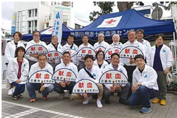
献血活動に参加した南部地区会の皆さん (午前中のメンバー)

緊急事態宣言下の活動に戸惑いはあったが、輸血用の血液がコロナ禍で不足しているとのことから、献血で助かる命があることを訴え、72名と多くの方に申し出て頂いた。改めて血液は人工的に作ることができないことを知り、献血活動の大切さを再認識した日だった。