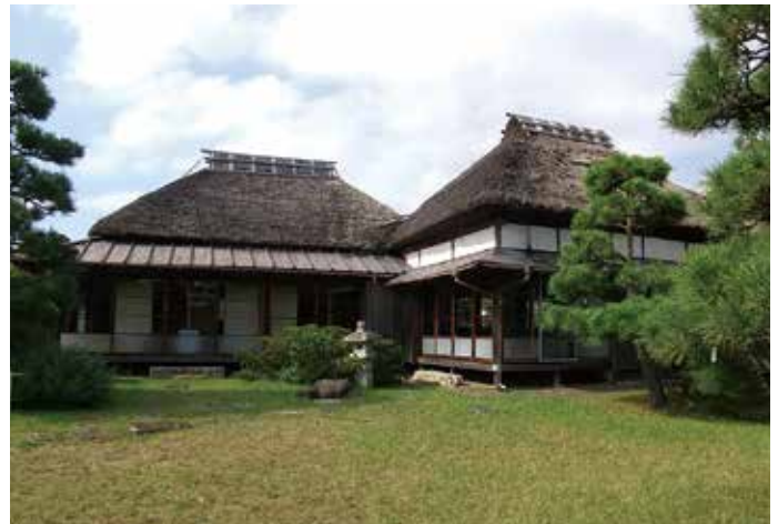
万代会館と美しい庭園（横須賀市津久井）

京急津久井浜駅を海岸方面へ出て、ラーメン屋さんの角を奥に進むと横須賀市立万代会館があります。