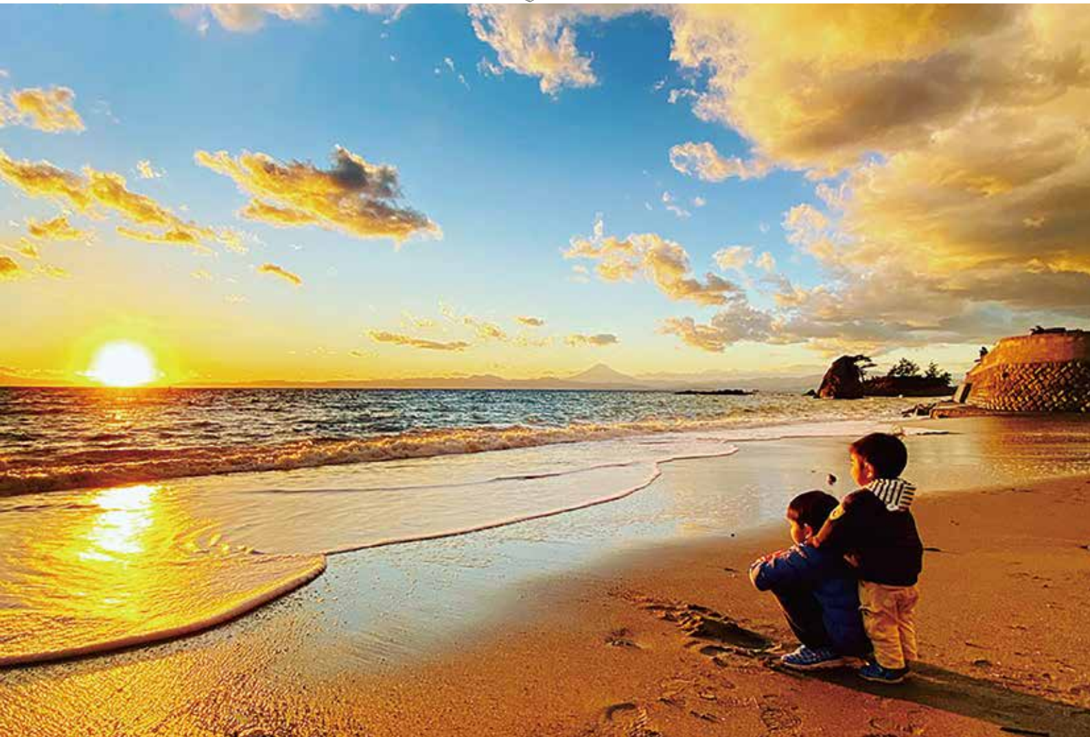
「一年最後の夕陽を眺める息子たち」 横須賀フォトコンテスト2020佳作（秋谷海岸）