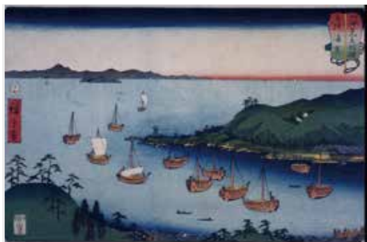
江戸時代の浦賀の様子を描いた浮世絵 広重画「山海見立相模 相模浦賀」(横須賀市自然・人文博物館所蔵)