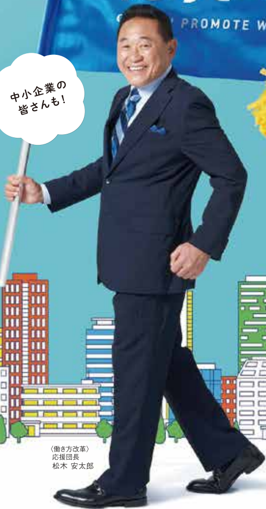
〈働き方改革〉 応援団長 松木 安太郎