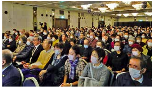
2/17 三浦半島青年団体交流会 講演会 於：セントラルホテル テーマ「自分を前に進める力」 講師：元財務官僚・ニューヨーク州弁護士 山口 真由 氏 主 催／(公社)横須賀法人会青年部会・横須賀商工会議所青年部・(公社)横須賀青年会議所 三浦商工会議所青年部・(公社)三浦青年会議所・横須賀青年八日会