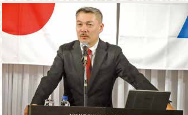
京都大学大学院 藤井 聡 教授