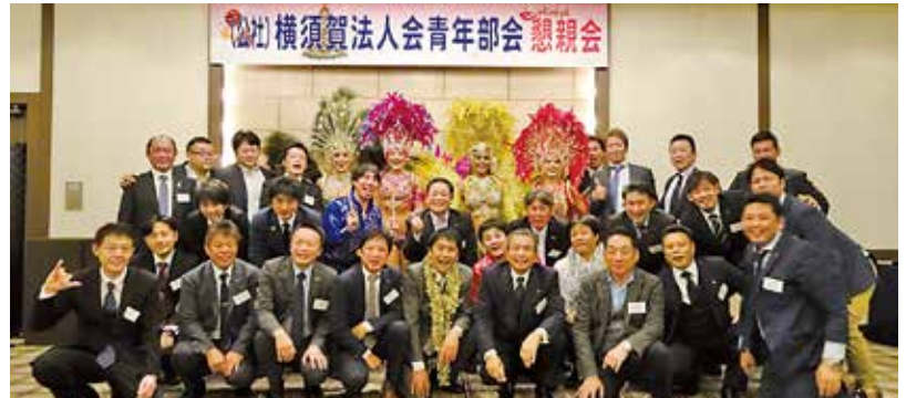
12/9 青年部会税制セミナー 於：セントラルホテル 懇親会も楽しく和気あいあいのうちに 写真㊦ テーマ「1時間でわかる税務署と税務調査の話」 講師：横須賀税務署長 黒木 政人氏 写真㊦