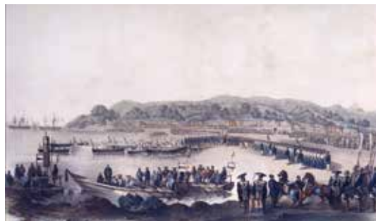
ハイネ画「ペリー久里浜上陸図」 (横須賀市自然・人文博物館所蔵)

今年は、浦賀奉行所開設300周年記念事業として「ポップサーカス」(住友重機械工業株式会社浦賀工場内特設大テント)が開催される(4/26~6/21)など、開国のまちを盛り上げます。