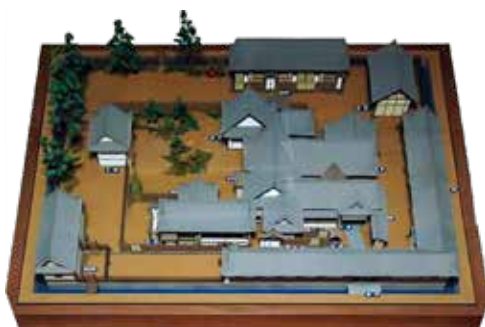
浦賀奉行所 模型 (浦賀コミュニティセンター分館所蔵)