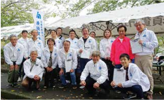
10/20 北久里浜秋まつり 税広報 東部地区会 於：根岸交通公園