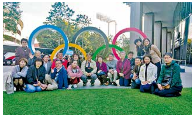
11/15 親睦旅行会 南部地区会 於：日本オリンピックミュージアム ほか