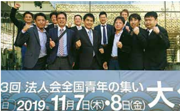
11/8 全国青年の集い大分大会 青年部会 於：いいちこ総合文化センター