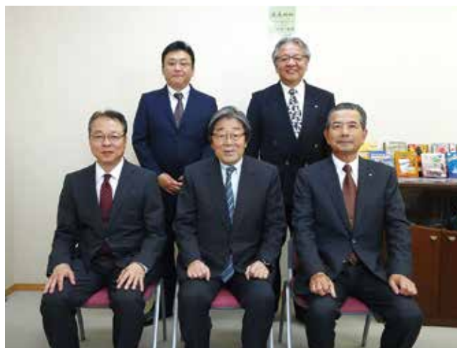
対談を終えた皆さんで