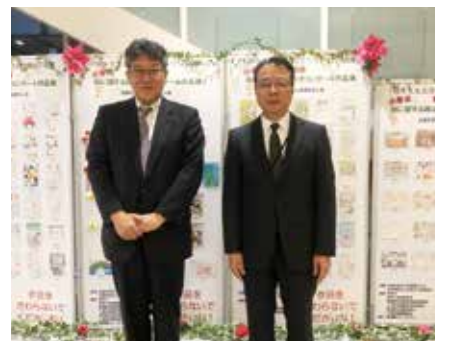
11/28 東京国税局・美並義人局長が当会 絵はがきコンクール作品展を閲覧される機会に恵まれました。(於：横須賀地方合同庁舎)