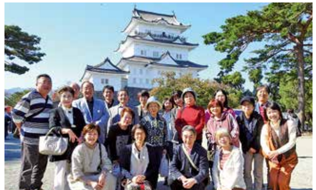
11/6 親睦旅行会 南西地区会 於：小田原城 ほか