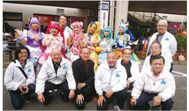
10/27 Yフェスタ追浜2019 北部地区会 於：京急追浜駅前