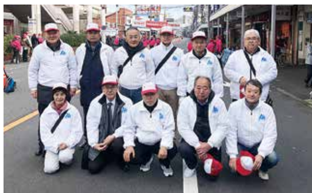
12/1 全国車椅子マラソン追浜チャンピオンシップ 北部地区会 於：京急追浜駅前