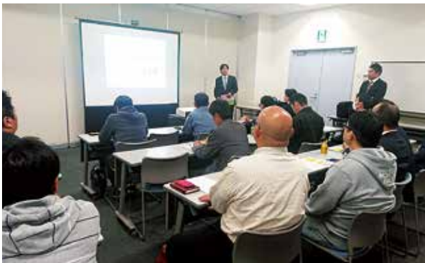
11/5 租税教室講師講習会 青年部会 於：横須賀商工会議所