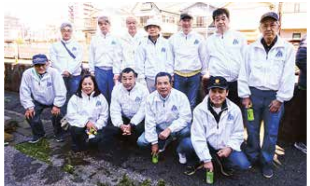
11/10 平作川クリーン大作戦 南西地区会 於：平作川流域