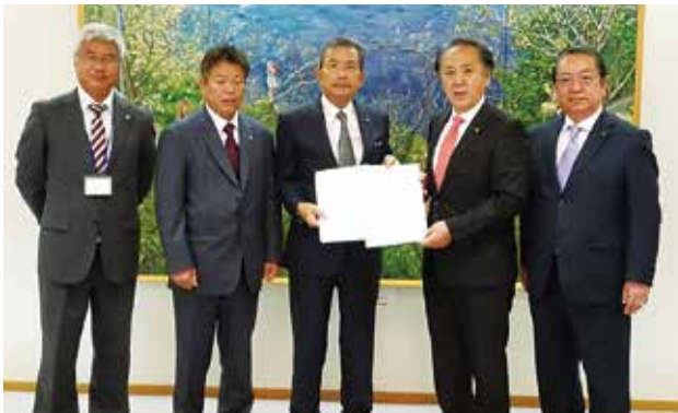
11/12 税制改正要望活動 上地克明横須賀市長 税制委員会 於：横須賀市役所市長室