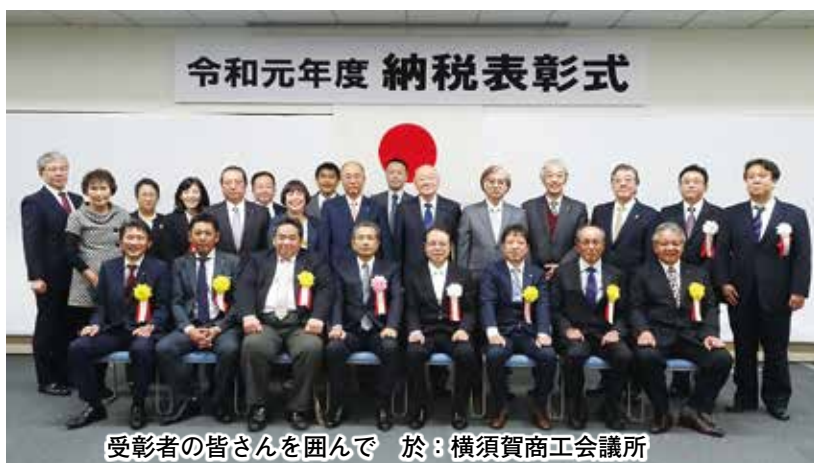
受彰者の皆さんを囲んで 於：横須賀商工会議所

今年度は、税務署長表彰2名、税務署長感謝状4名と、当会役員6名の皆様が晴れの受彰となった。法人会の役員として、永年にわたり率先垂範して円滑な税務行政の執行に寄与されたことに対し、敬意を表するものである。