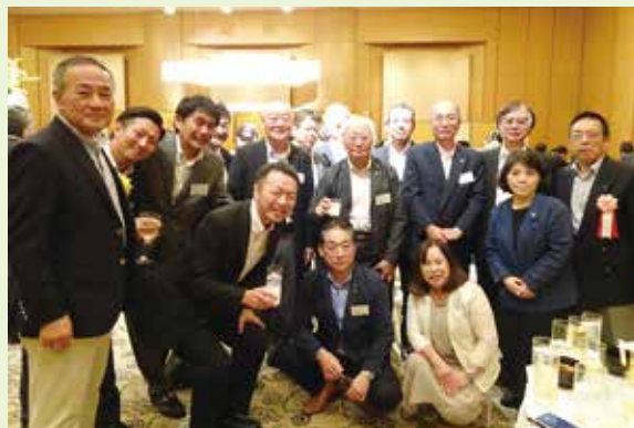
受賞者の皆さんを囲んで