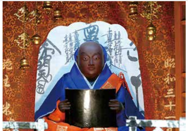
五妙の祖師像 木像 日蓮上人 妙栄寺所蔵

日蓮上人によって、法華経に帰依した石渡左衛門尉は、他の人々と図って深田台に草庵を建てました。これが御浦法華堂で、後に「猿海山龍本寺」となりました。この御浦法華堂こそ、宗門最初の霊場で、本堂を