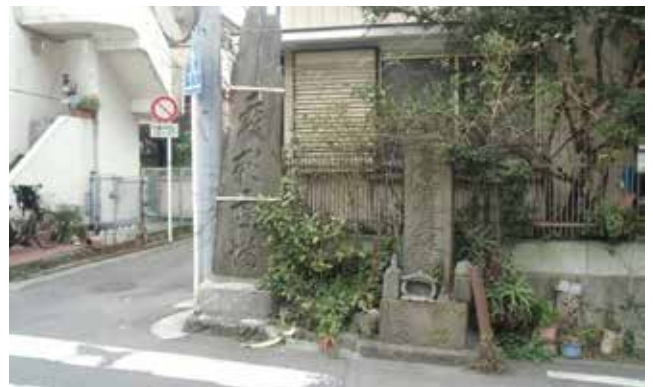
二基の法塔(横須賀市佐野町)