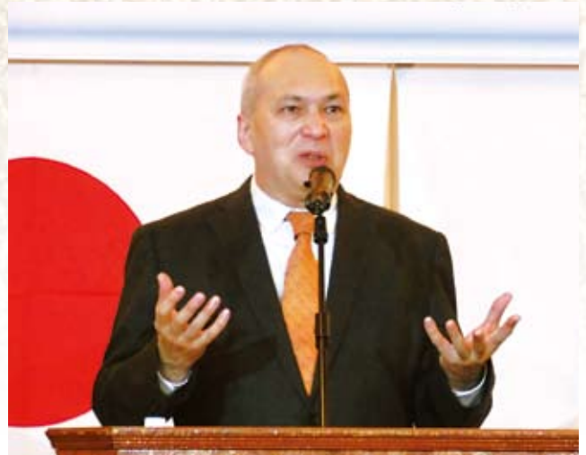
講師を務めたモーリー・ロバートソン氏

テーマは「これだけは言っておきたい！世界の中の日本」で、当日は一般公募の市民91名と会員合わせて212名がこの講演会に参加した。（於：セントラルホテル） —講演会の内容は以下の通り—