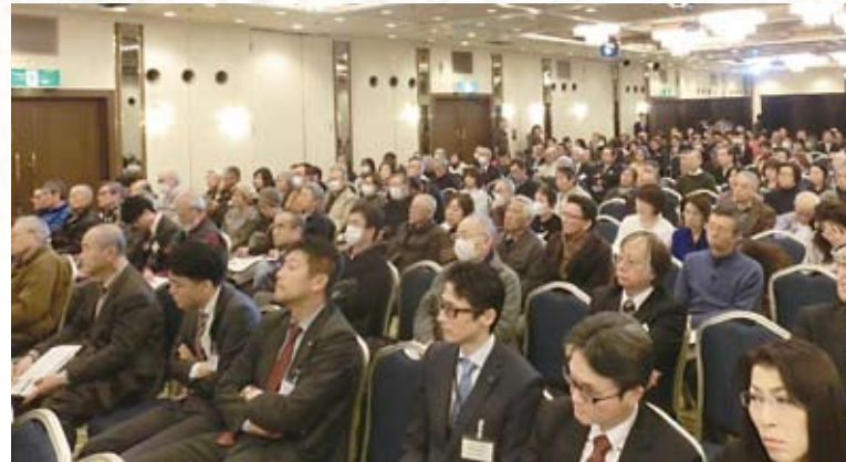
熱心に聴きいる参加者の皆さん