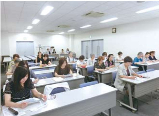
参加された女性部会のみなさん

7月5日、女性部会は改正消費税と軽減税率制度について、研修会を実施した。(於：横須賀商工会議所)