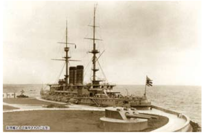
横須賀白浜の地に記念艦として保存された「三笠」

乗組員にも多数の死傷者が出ました。弾薬庫の爆発ということ自体が、日本海軍始まって以来のことです