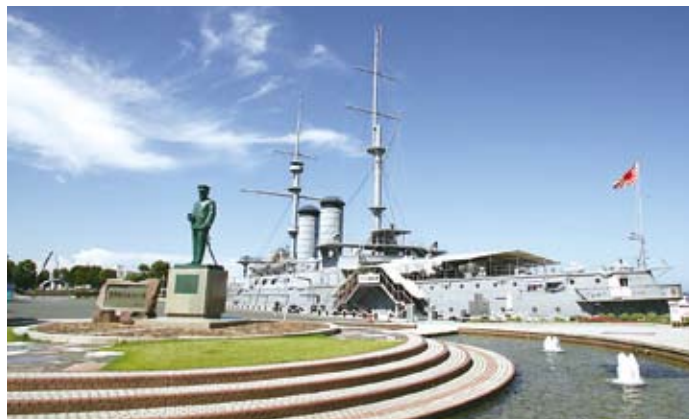
日本遺産に指定された 現在の世界三大記念艦「三笠」

る大国に、資金のない日本が勝つためには、まず、短期決戦で早い段階でロシアに圧勝し、講和条約を結ぶ必要がありました。