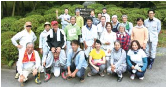
下草刈りに参加した皆さん