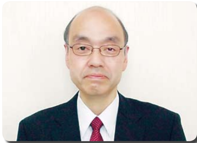
横須賀税務署長 阿部豊明氏

法人担当副署長には、繪柳 誠氏が着任、法人課税部門では、第1部門・緒方砂保氏、第2部門・富山由貴氏と女性統括官が新たに着任して、新体制がスタートしている。