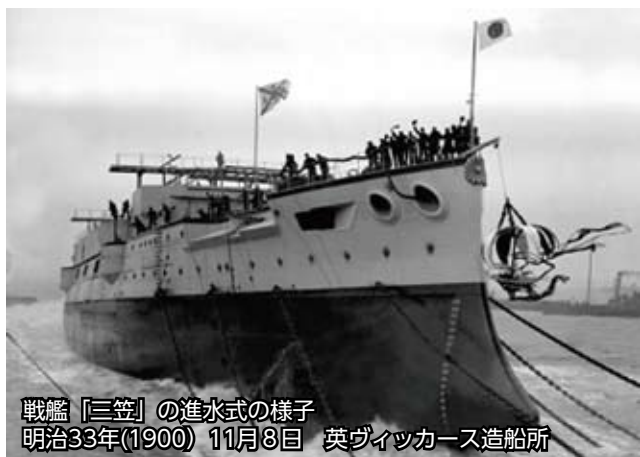
戦艦「三笠」の進水式の様子 明治33年(1900)11月3日 英ヴィッカーズ造船所

「三笠」は明治35年(1902)、日本海軍の戦艦としてイギリスのヴィッカーズ造船所で就役しました。