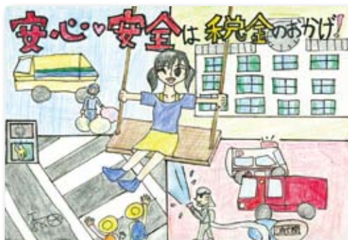
横須賀法人会女性部会長賞 横須賀市立野比東小学校5年