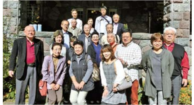
10/27 北部地区会移動研修会 於：日光 明治の館