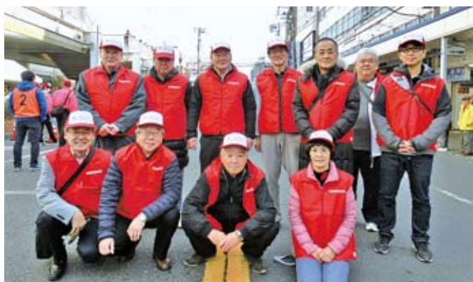
12/4 全国車椅子マラソン追浜チャンピオンシップ 北部地区会社会貢献活動 於：京急追浜駅前