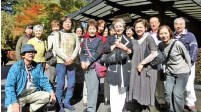
10/26 南西地区会親睦旅行会 於：軽井沢 万平ホテル