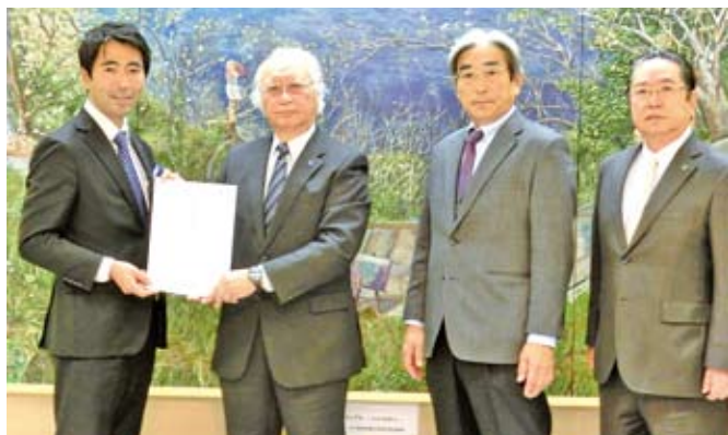
11/16 税制改正要望活動 横須賀市 吉田雄人市長（左から1人目）