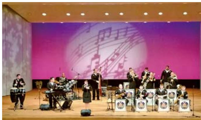
11/22 米海軍第7艦隊音楽隊コンサートのようす 於：横須賀市文化会館