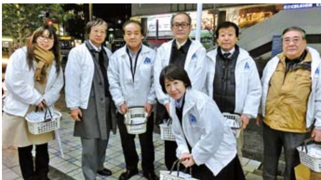
11/12 「税を考える週間」南部地区会税広報活動 於：京急久里浜ウイング前