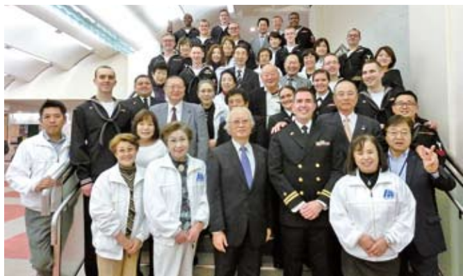
11/22 米海軍第7艦隊音楽隊コンサートの後でスタッフの皆さんと 於：横須賀市文化会館