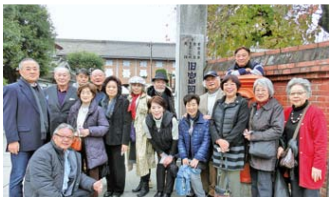
11/27 親睦旅行会 於：富岡製糸場