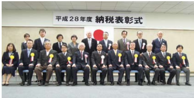
受彰者の皆さんを囲んで 於：横須賀商工会議所