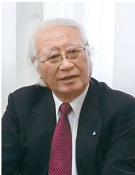
(公社)横須賀法人会会長