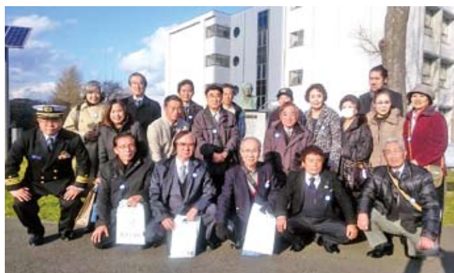
12/7 南部地区会親睦会 於：防衛大学校