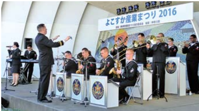
11/5 よこすか産業まつり2016 法人会の招待で演奏する米海軍第7艦隊音楽隊 於：三笠公園