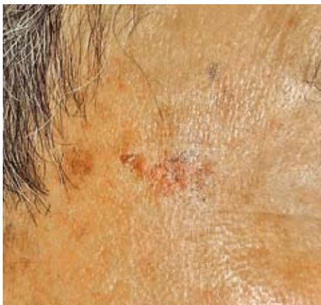
こめかみの日光角化症の症例写真

顔面や手・背などの日光によく当たる部位に直径数mm～1cm程度の大きさのカサブタのつく淡い紅斑が生じます。皮角と呼ばれる角状の突出がみられることもあります。色素沈着を生じることもあり、その際はいわゆるシミと見分けが付きにくいことがあります。急激に大きくなって隆起してきた場合は癌が進行した可能性が高いです。