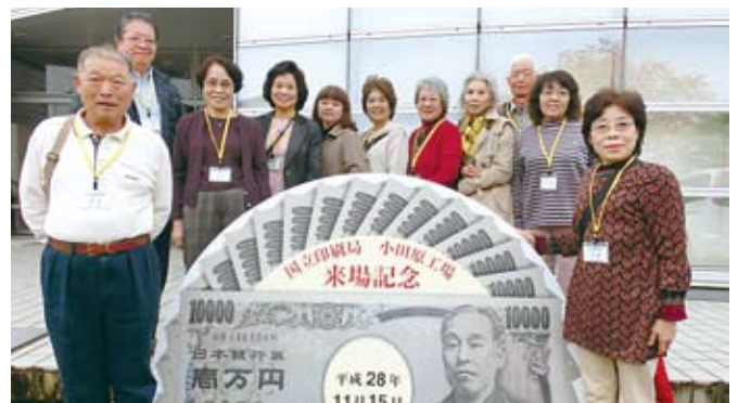
11/15 西部地区会移動研修会 於：国立印刷局小田原工場