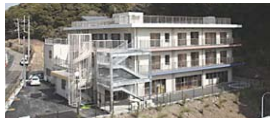
しらかば子どもの家外観 (横須賀市長瀬)

児童福祉法第41条に基づき、さまざまな事情により保護者と暮らせない2歳から18歳までの子どもたちをお預かりして養育することを目的とした児童養護施設です。ひとり一人の子どもたちの発達を見守り、心身共に健全な社会人の一人として生きていけるよう支援していきます。