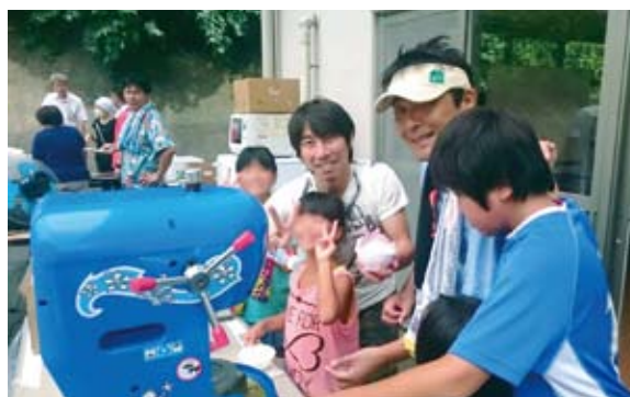
かき氷のメンバーには、早くもファンクラブができていました。