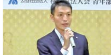
熱心に聴く 参加メンバー①