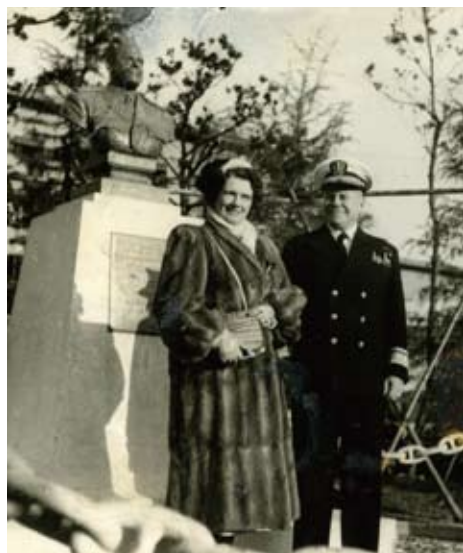
昭和24年11月 横須賀商工会議所主催の胸像の除幕式にエレナ夫人と出席したデッカー司令官(右) 場所は現在の市役所前公園で、平成7年に現在の中央公園に移設された

デッカー司令官の、その人柄と生きた時代の記憶は薄れつつありますが、横須賀市民が語り継ぐべき重要な人物の一人です。