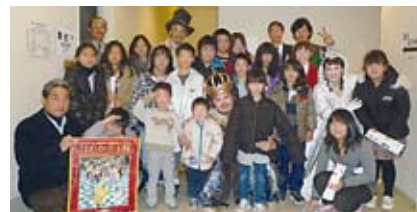
平成23年12月 劇団四季公演「はだかの王様」観賞後、楽屋で団員の皆さんと記念撮影