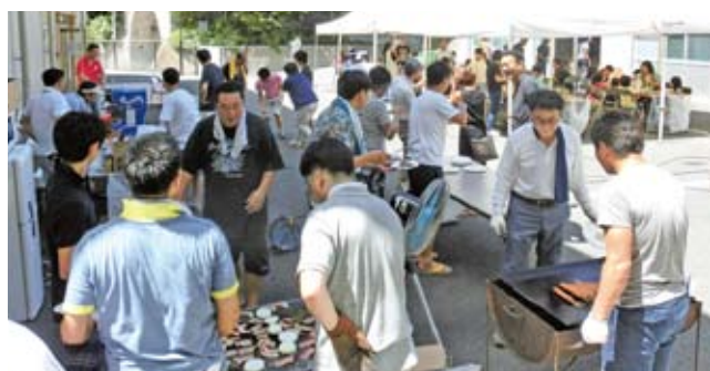
焼き方のメンバー、本当に暑いなか頑張りました。