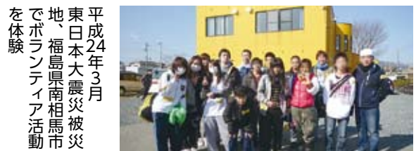
平成24年3月 東日本大震災被災地、福島県南相馬市でボランティア活動を体験