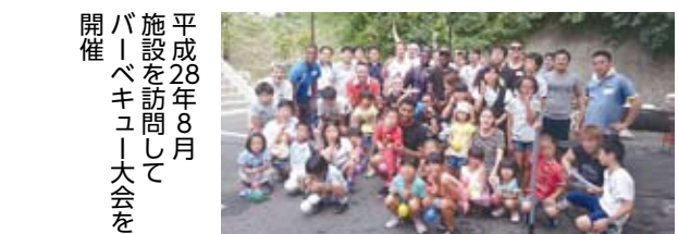
平成28年8月 施設を訪問してバーベキュー大会を開催

しらかば子どもの家・しらかばベビーホームと同後援会の詳細はホームページやfacebook等でご覧ください