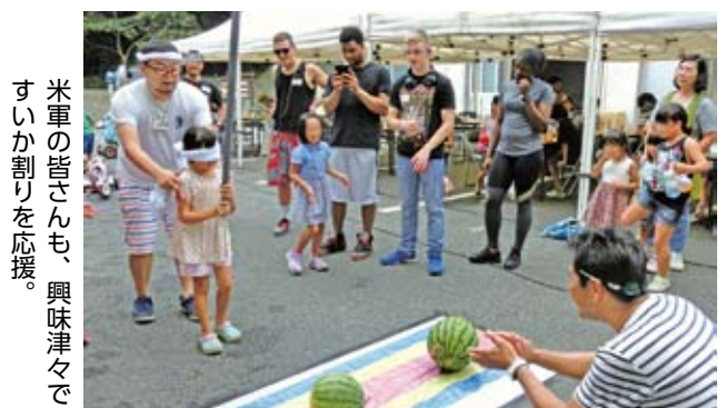
米軍の皆さんも、興味津々ですいか割りを応援。