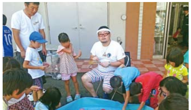
お祭りのヨーヨーのお兄さんではありません。美容師です。信じて下さい。

夏休み子どもたちと楽しい一日を過ごした。また、米海軍横須賀基地からも8名の軍人がボランティアとして参加し、子供たちと一生懸命コミュニケーションを取って盛り上げてくれた。