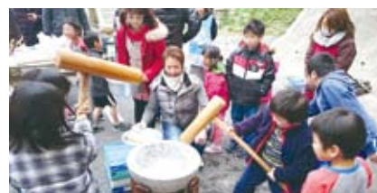
平成28年1月 施設を訪問して餅つき大会を開催