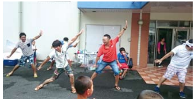
日中に初めて披露した「スパイダーマン」ダンス