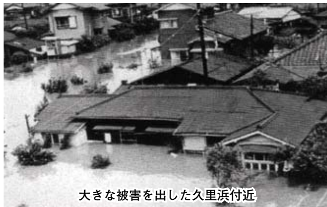
大きな被害を出した久里浜付近

かつては、上流から下流まで、ドジョウやフナ、ウナギなどが獲れて、川で遊ぶ子ども達や、釣りをする人の姿が見られた。時代を遡ると、まだ水道がないころは、野菜を洗ったり洗濯をしたりと、平作川はその流域の人々の生活とともにあった。