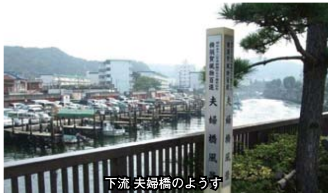
下流 夫婦橋のようす

上流の阿部倉温泉、池上親水公園から、公郷町の宮原橋まで、15年にわたるこの活動が功を奏して、中流域にはコイが1,500匹確認され、カワセミやカルガモなどの野鳥や、植生物が年々多くみられるようになり、美しい平作川を取り戻しつつある。