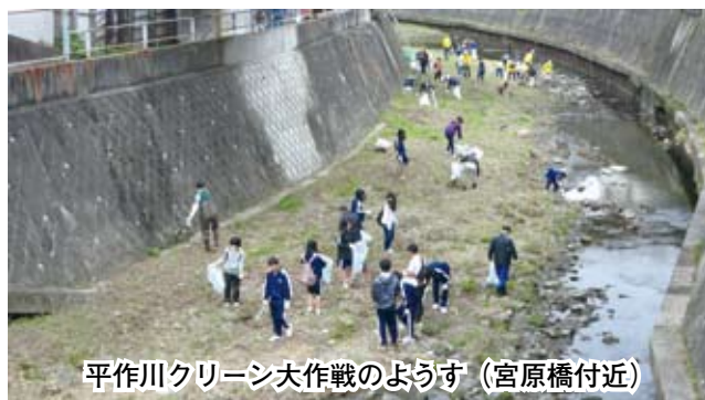
平作川クリーン大作戦のようす(宮原橋付近)

現在は、『平作川クリーン大作戦』(同実行委員会主催)に、流域自治会・町内会、小・中学校、高校、企業・団体、法人会など、毎年約1,000名が参加して、河川の清掃活動が行われている。