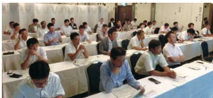
熱心に聞き入る青年部会のメンバー