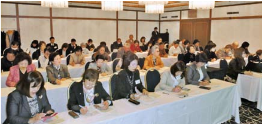
4/9 女性部会『ふるさと納税』を研修 於：セントラルホテル