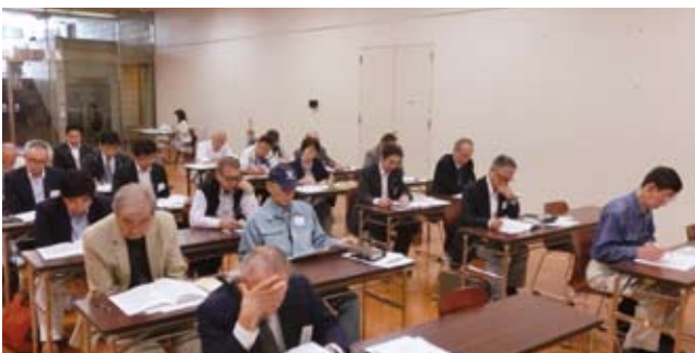
5/11 南西地区会研修会・事業報告会 於：横須賀市はまゆう会館