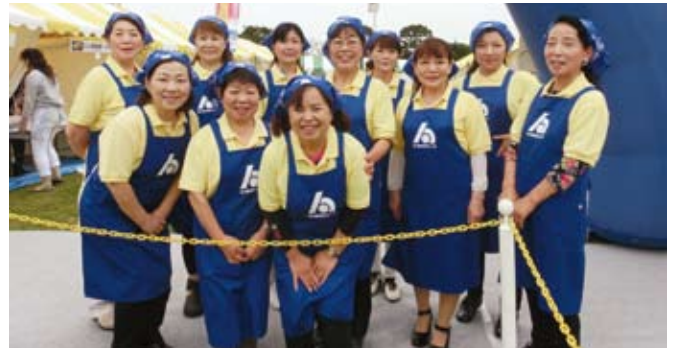
5/9 よこすかカレーフェスティバル2015 早速お手伝いです！ 於：三笠公園