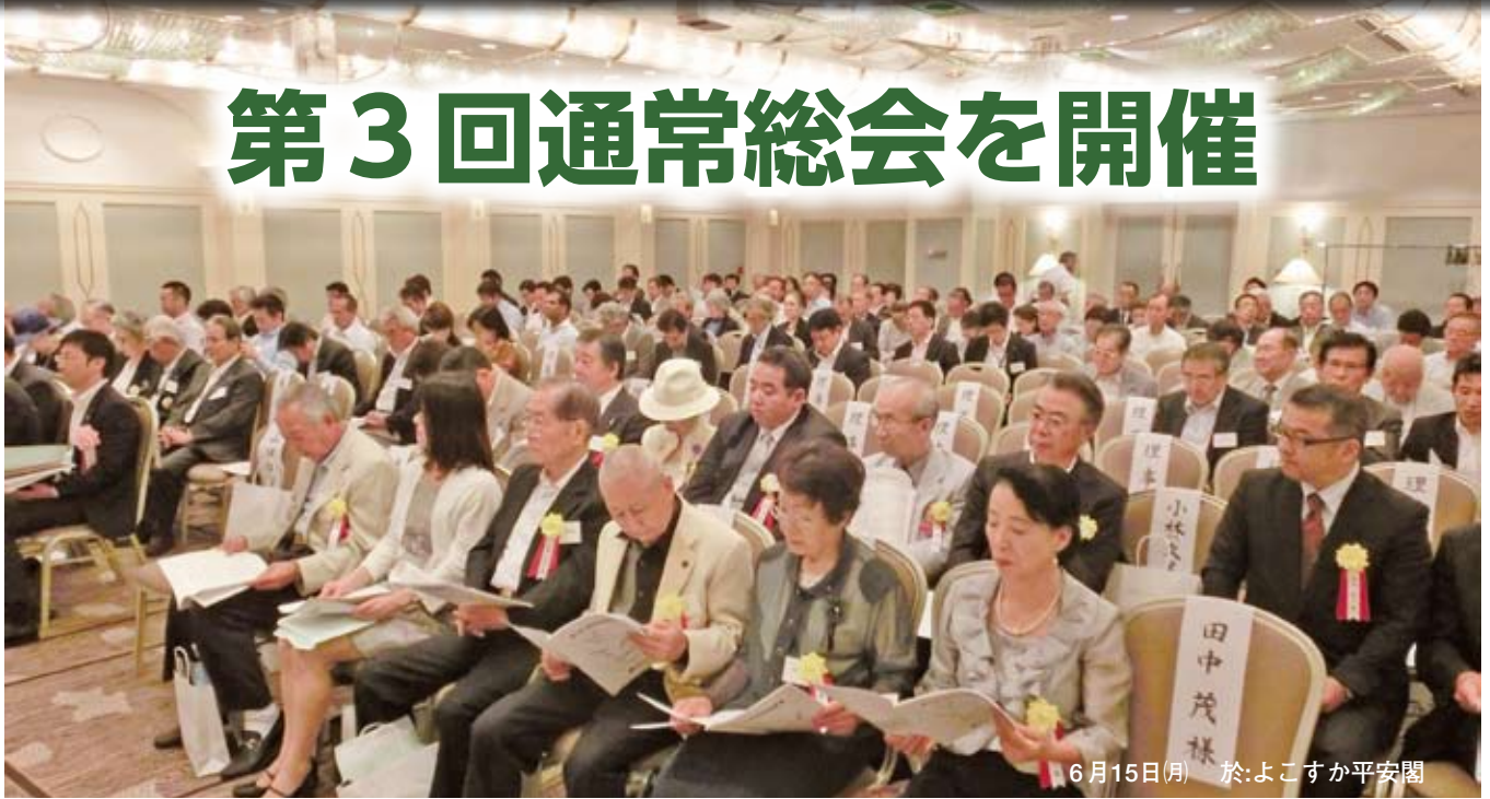
6月15日(月) 於:よこすか平安閣