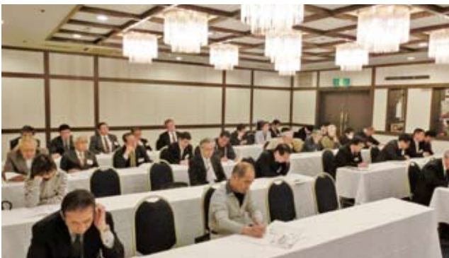
4/15 中央第1地区会研修会・事業報告会 於：セントラルホテル

4月15日(中央第1地区会)、27日(東部地区会)、5月11日(南西地区会)、13日(南部地区会)と、各地でマイナンバー制度研修会が開催された。