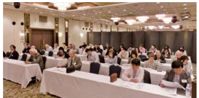
5/13 南部地区会研修会・事業報告会 於：セントラルホテル