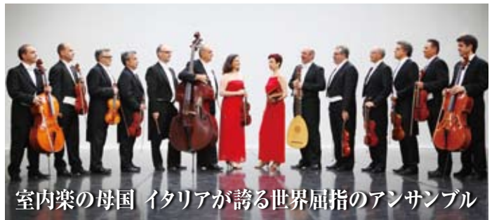
室内楽の母国 イタリアが誇る世界屈指のアンサンブル

公演日 平成26年11月22日(土) 会場名 よこすか芸術劇場 (大劇場) 開演時間 15時00分 (開場時間14時30分) 料金 S席：4,700円 (定価) →4,230円 (10%引) 主催 (公財)横須賀芸術文化財団 その他 未就学児童入場不可。