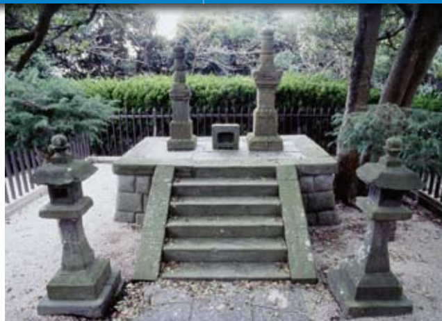
国指定史跡「三浦按針墓」右塔が按針、左塔が妻ゆきの供養塔

1605年（慶長10年）、家康は、帆船建造の功績を賞し、アダムスに帯刀を許したのみならず、相州三浦郡逸見村（横須賀市逸見）に、二百五十石の土地を授け、三浦按針と名乗らせ旗本侍としました。「按針」とは水先案内人の意味で、逸見は日本で唯一外国人が領主として治めた歴史上貴重な村となりました。