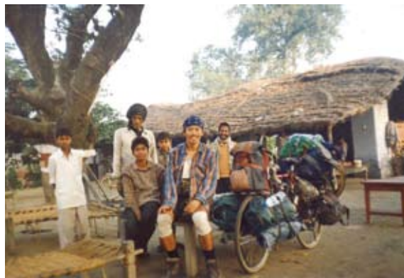
インドのゼロ田宿で レストランの仮眠所

中国も5か月走りましたが、砂漠で水がなくなって焦っていた時に、大切なはずの水をくれて助けてくれたり、反日感情なんて一度も感じたことはありませんでした。乾ききった体に水を入れた瞬間、体が震えて、それまで自分と全く縁のなかった人が、家族のように助けてく