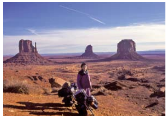
大自然に魅了され、4日間も滞在したアメリカ・モニュメントバレー

到着してからなんと4日目に、ようやく意を決して街を出ると、すぐに大自然が目の前に広がって、めちゃくちゃ綺麗で感動しました。行動は力を与えてくれます。勇気が出てきて7年半の旅がスタートしました。