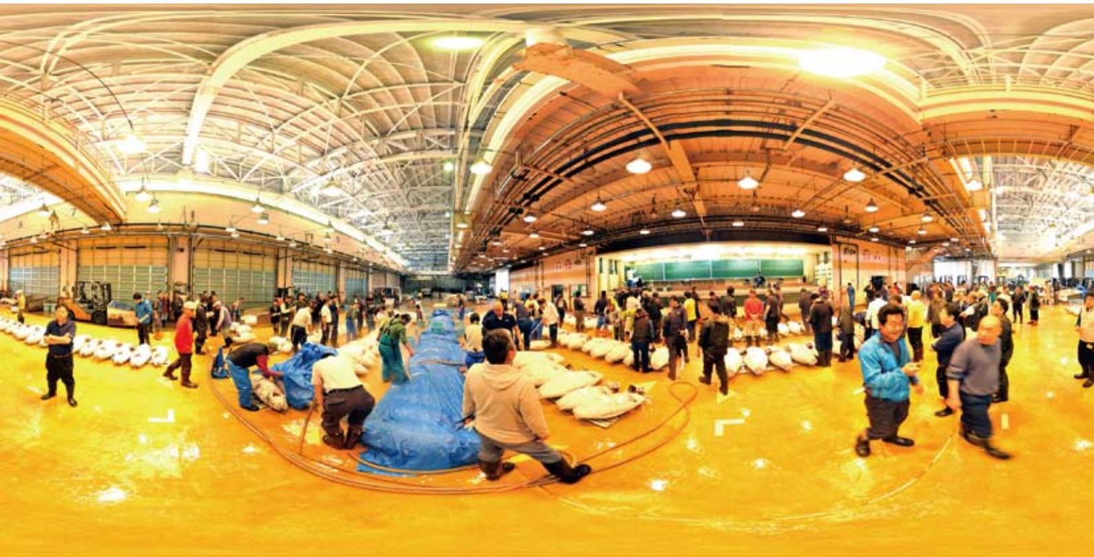
みさき魚市場 マグロの競りのようす

正式名称は三浦市三崎水産物地方卸売市場。地元ではみさき魚市場で親しまれています。冷凍マグロの取引が有名で、1日に400~1,000本の取引があるそうです。 (10枚の写真をパノラマ合成 撮影・文/ 3DSurveyplus 堂城川 厚)