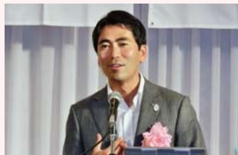
横須賀市長 吉田雄人氏