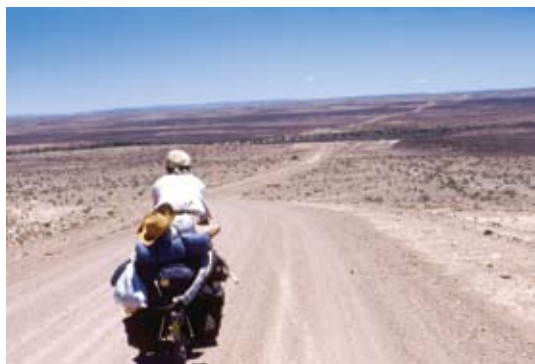
ナミビア・天へ向かう道 7年半で自転車のパンクは184回、 タイヤは37本替えた

ペルーでは、3人組の強盗に襲われました。拳銃を突きつけられ、手足を縛られ「ここで旅が終わるのか」と思うと、なんて格好悪いんだろうと思いましたが、撃たれないと感じたとき、恐怖心がなくなり、「自転車だけは置いていってくれ」と頼んだら本当に置いて行ってくれて、旅を続けることができました。