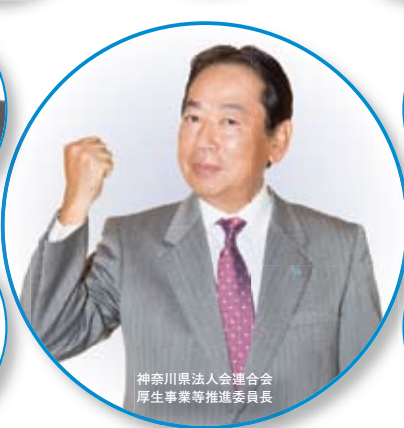
神奈川県法人会連合会 厚生事業等推進委員長