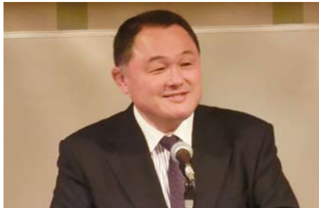
熱い想いを語る 山下泰裕氏

そして、子供たちが、瞳を輝かして明るい笑顔で、夢を持って生きられるような、柔道で学んだフェアプレーと思いやりに溢れた社会になってほしいと願っています。