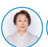
神奈川県法人会連合会 女性部会長