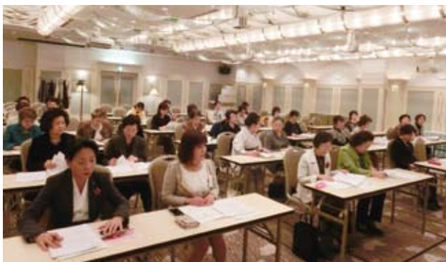
参加した女性部会の皆さんと一般公募の皆さん