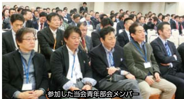
参加した当会青年部会メンバー

震災のあの日の思いを忘れずに、被災地の方々とともに復興を見届けたいという、強い決意が伝わる講演だった。