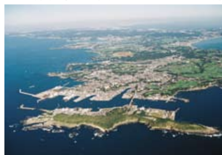
城ヶ島より三浦半島を望む

ミシュランが認めた三浦半島。豊かな自然に囲まれた魅力いっぱいの三浦半島を、私達はもっと多くの方に知って頂けるよう努力して行きたいものです。