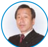
神奈川県法人会連合会 厚生担当副会長