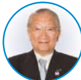
神奈川県法人会連合会 会長