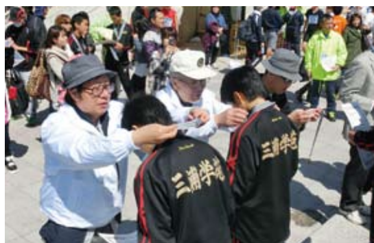
表彰式で入賞者にメダルを掛ける、石渡地区会長(右)と金井北下浦支部長