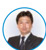
神奈川県法人会連合会 事務局長