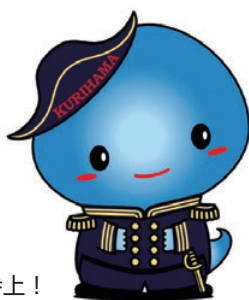
久里浜限定スカリン提督参上!

当日は、役員10名が『申告と納税は便利なe-Taxで』と書かれたポケットティッシュや全法連女性部会が作成したうちわなどを配布して、イベントを盛り上げた。