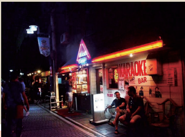
夜は、米軍の社交場として賑わう どぶ板通り

地域ぐるみの協力に市の応援で、さらに活気あるどぶ板通り周辺になる予感のドル旅、横須賀ならではの企画にさらなるアイデアが広がることだろう。