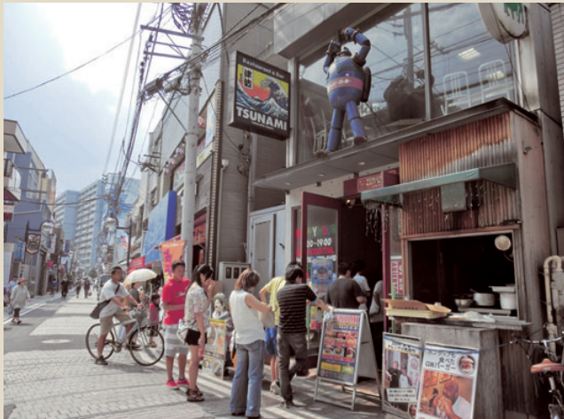
この日（8月13日）も昼からの行列が午後3時過ぎまで続いた人気店「TSUNAMI」

多くのマスメディアが取り上げ、主要新聞各社・テレビ・ラジオ・雑誌にWEBと、放映や発行後には、市内外から多くの観光客がドル紙幣を持って訪れた。