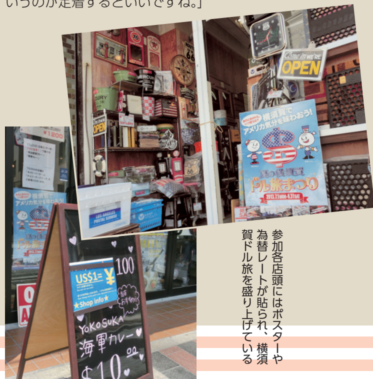
参加各店頭にはポスターや為替レートが貼られ、横須賀ドル旅を盛り上げている

個々の店舗では、宣伝すらも難しいですが、街全体でやれば盛り上がります。まずは、1回で終わらずに2回3回と続けて、横須賀はドルで買い物ができるというのが定着するといいですね。」