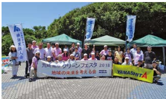
6/3 荒崎海岸クリーンフェスタ2018 (西部地区会) 於：荒崎海岸なんやの浜