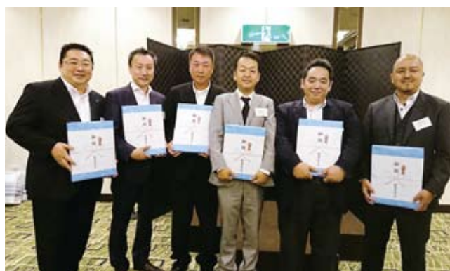
5/15 青年部会事業報告会「僕たち卒業しました」 於：セントラルホテル