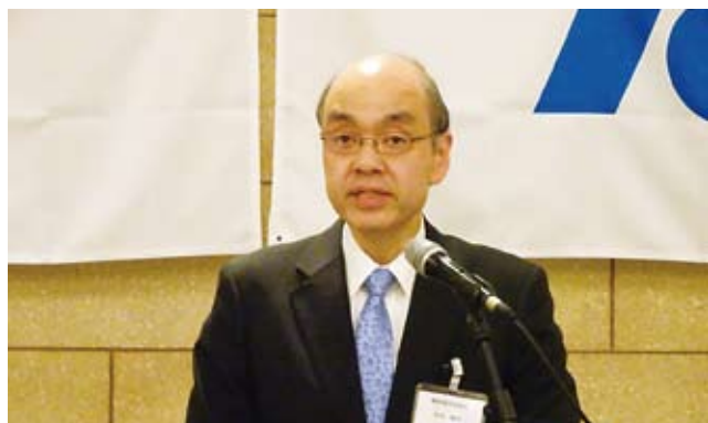
4/23 女性部会税務研修会で講師を務めた 阿部税務署長 於：セントラルホテル