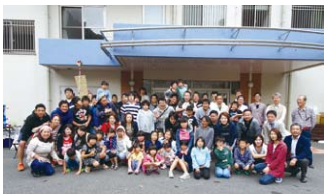
5/13 青年部会 しらかば子どもの家訪問 キャンプ風BQ大会を開催