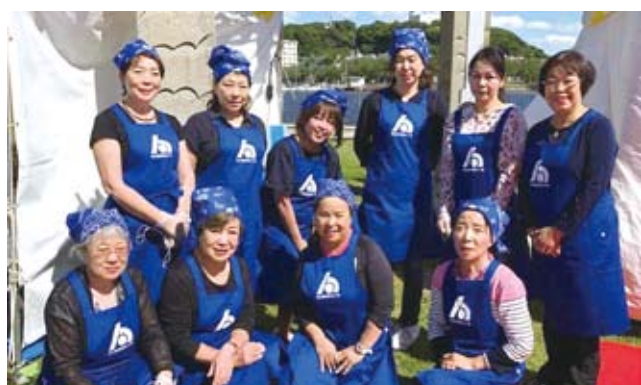
5/20 女性部会 よこすかカレーフェスティバル2018 於：三笠公園