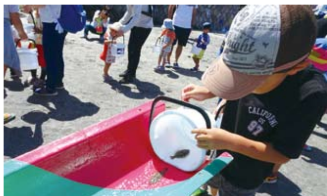
6/3 荒崎海岸クリーンフェスタ2018 (西部地区会) 稚魚の放流 於：荒崎海岸なんやの浜