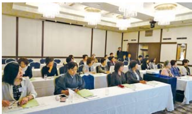
4/23 女性部会税務研修会・事業報告会 於：セントラルホテル

年度初めは 地区会・部会の事業報告会や研修会、さらにボランティア活動などが実施され、多くの会員交流がありました。