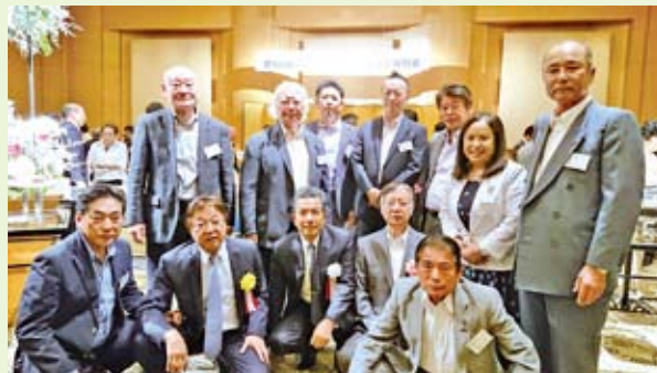
受彰者の皆さんを囲んで