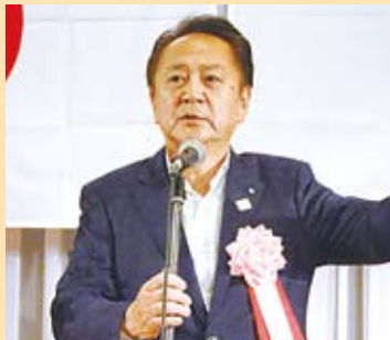
横須賀市長 上地克明氏