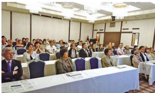
5/16 東部地区会研修会・事業報告会 於：セントラルホテル