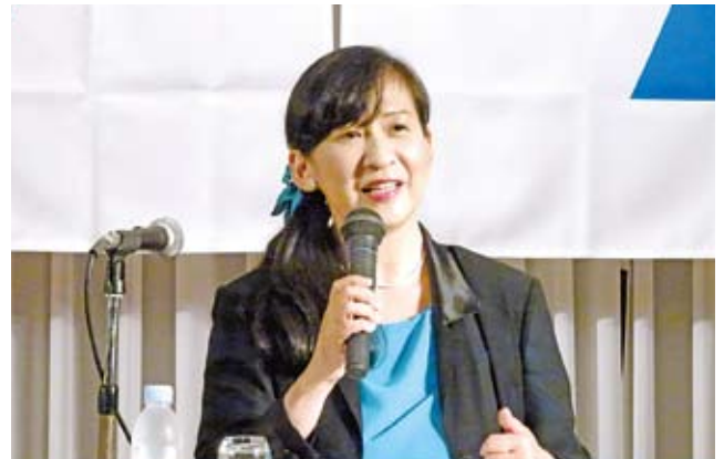
皇室ジャーナリスト 高清水有子先生